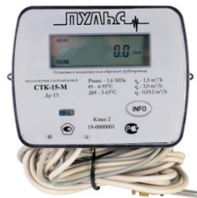
Рисунок 1. Внешний вид теплосчетчика.